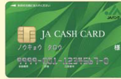
ICキャッシュカード